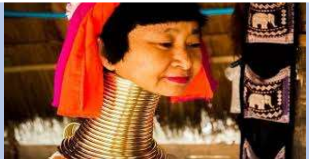
“Mujer jirafa” kayan.