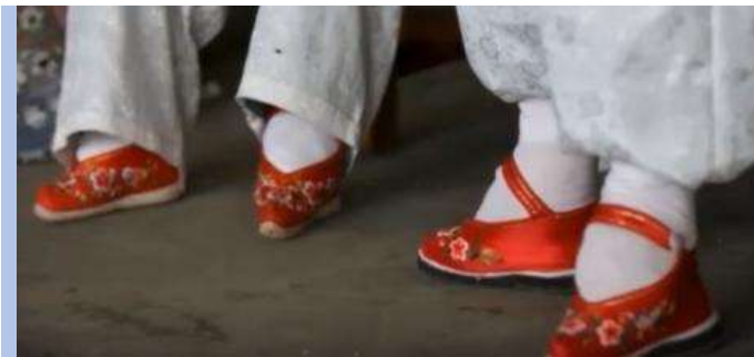
Los denominados “pies de loto” de las ancianas chinas.

Al quitárselos, se ve condenada a vivir recostada o a sujetar su cabeza constantemente con las dos manos.